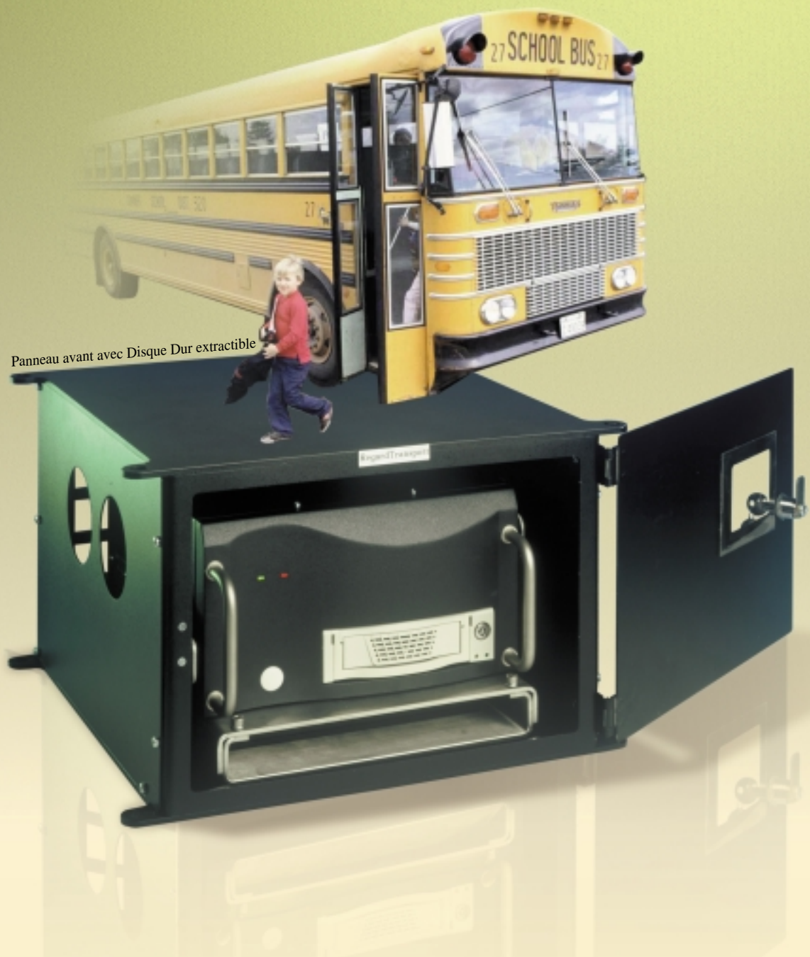
Panneau avant avec Disque Dur extractible

Combiné avec une interface de transmission sans fil pour l'observation et la commande à distance ou employé comme une unité d'enregistrement autonome, RegardTransport est la solution idéale pour la surveillance et l'enregistrement d'incidents dans des applications mobiles.