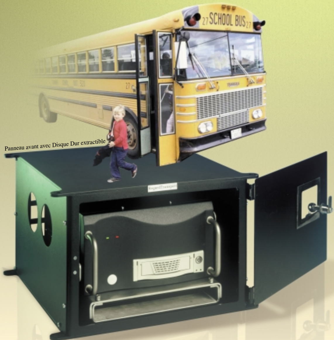
Panneau avant avec Disque Dur extractible

Combiné avec une interface de transmission sans fil pour l'observation et la commande à distance ou employé comme une unité d'enregistrement autonome, RegardTransport est la solution idéale pour la surveillance et l'enregistrement d'incidents dans des applications mobiles.